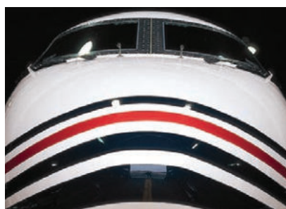
Idealna linia odcięcia