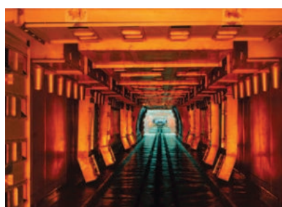
Temperatura suszenia aż do 160°C