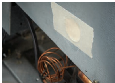
Uszczelnianie przy pianowaniu