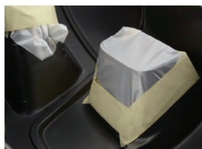
Łatwe i szczelne oklejanie nierównych powierzchni