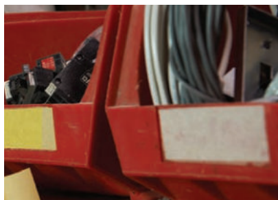
Możliwość przyklejania wszędzie tam gdzie chcesz