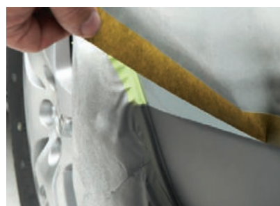
Nie pozostawia śladu