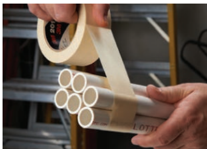
Szybkie i łatwe łączenie wiązek