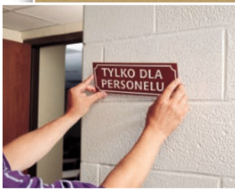
Przyklejanie tabliczek z opisami (taśma 9529, 9536)