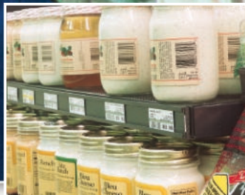
Przyklejanie listew cenowych do regałów sklepowych (taśma 9528, 9536)