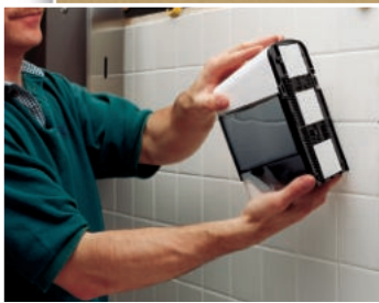
Przyklejanie dyspensera (taśma 9540)