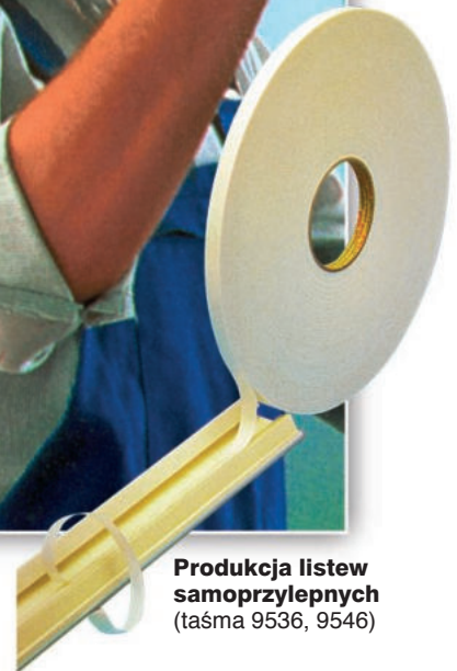
Produkcja listew samoprzylepnych (taśma 9536, 9546)