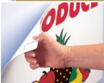
Tymczasowe mocowanie plakatów reklamowych (taśma 4658F)