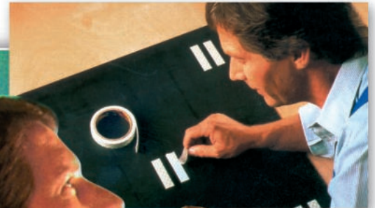
Przyklejanie luster (taśma 4026)