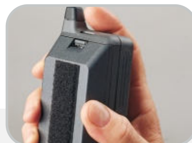
Mocowanie drobnego sprzętu elektronicznego. Powierzchnia, na której sprzęt jest mocowany nie zostanie uszkodzona przez otwory pod śruby.