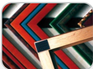
Próbki ram do obrazów mocowane na tablicy w punkcie usługowym.