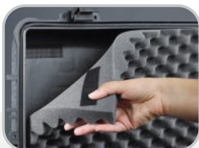
Mocowanie gąbki wyścielającej walizkę.